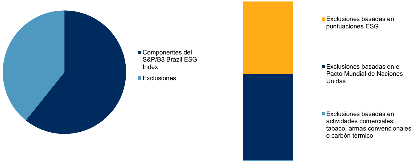
Figura 1: Construcción del S&P/B3 Brazil ESG Index

Fuente: S&P Dow Jones Indices LLC. Datos al 30 de abril de 2020. Los gráficos poseen fines ilustrativos.